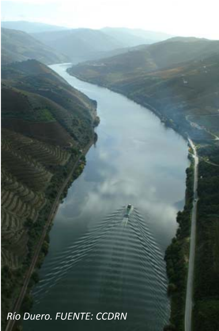
Río Duero.