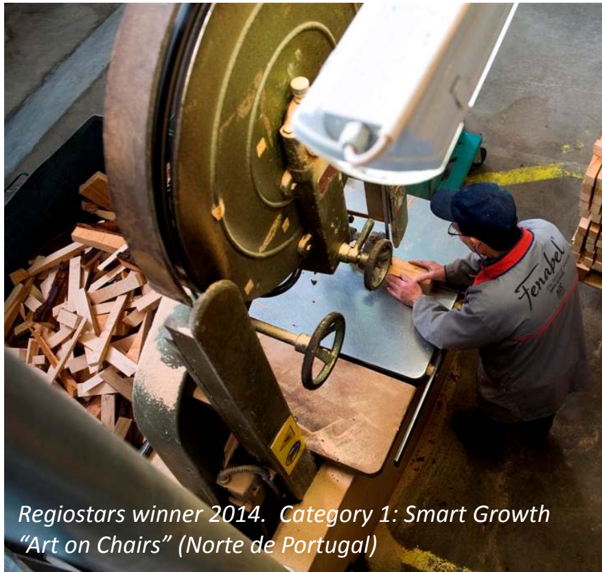
Regiostars winner 2014. Category 1: Smart Growth "Art on Chairs" (Norte de Portugal)