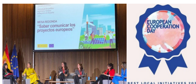
Izda: Evento anual de la DG de Fondos Europeos Derecha: Premio EC Day