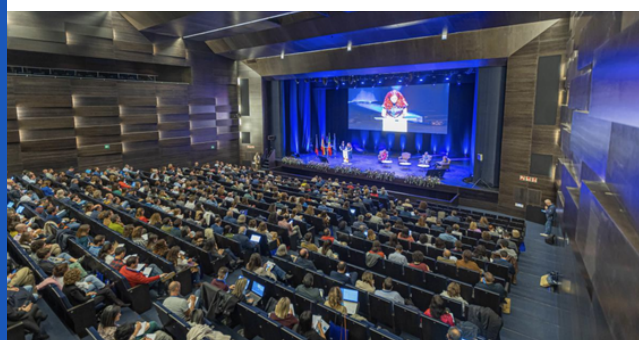
Más de 700 personas asistieron al evento de lanzamiento con varias sesiones técnicas y de networking en Ayamonte.