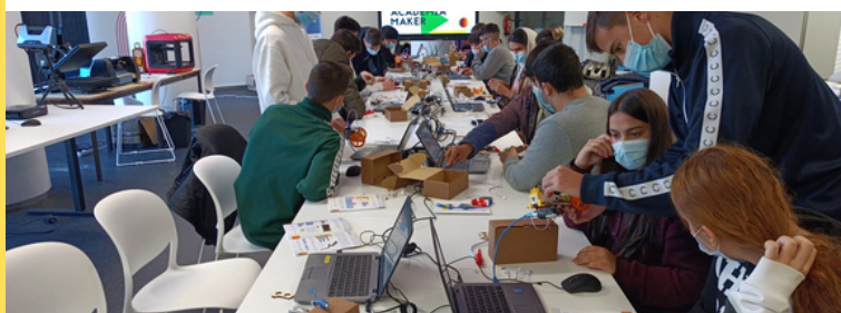
Entidades beneficiarias participaron en el concurso POCTEP de foto y vídeo con motivo del EC Day 2022. De arriba a abajo: proyectos VALUETUR, LOCALCIR y EMPRENDEMAKERS

El acompañamiento y seguimiento de las acciones de ICV de los proyectos POCTEP por parte del Programa ha continuado en 2022 para lograr un efecto multiplicador de sus acciones y resultados.