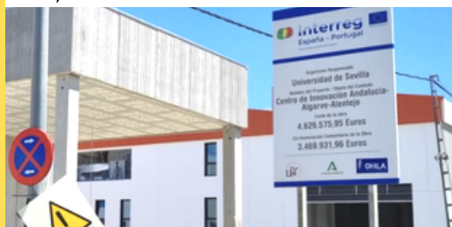
Las grandes obras previstas en los proyectos estratégicos de la 3ª convocatoria ya están en curso.

La 1ª convocatoria , con 135 proyectos , presentaba a 31/12/2022 una ejecución financiera del 83,92%, si bien la ejecución media de los proyectos completamente cerrados supera el 93%.