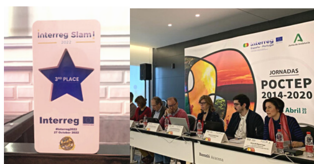
Izquierda: Premio en el Interreg Slam 2022 Derecha: Jornadas POCTEP Andalucía

Además, ha continuado la divulgación de proyectos a la Comisión Europea y a medios de comunicación como Euronews ( Stories from the regions ) o Agencia EFE ( Historias Ibéricas ).