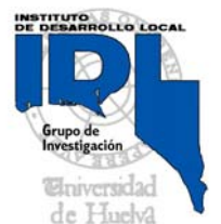
INSTITUTO DE DESARROLLO LOCAL IDL Grupo de Investigación Universidad de Huelva