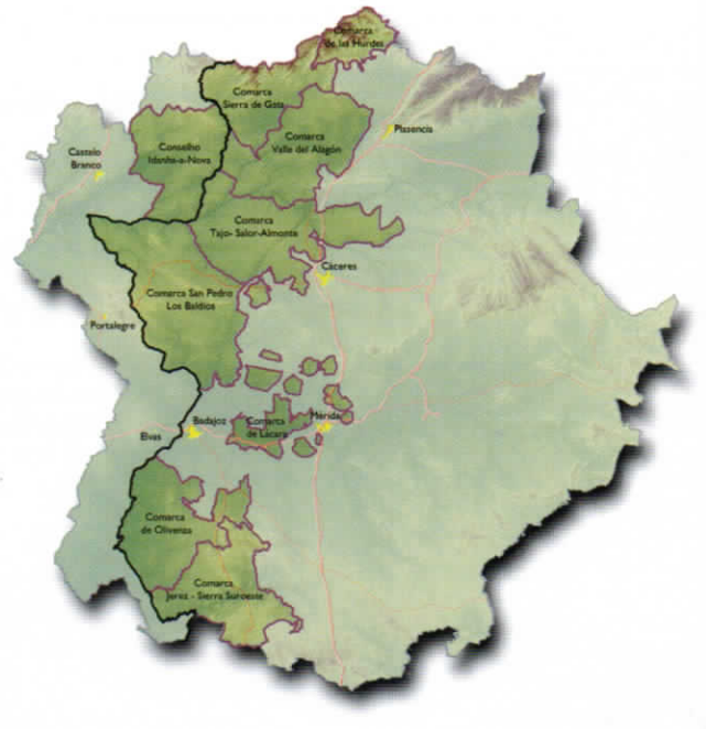
AMBITO ACTUAL DE LA ASOCIACIÓN LA RAYA-A RAIA

Os sócios extremeños da La Raya/ A Raia são: Adisgata, Adic- Hurdes, Adesval, Sierra de San Pedro- Los Baldíos, Adecom-Lácara, Aderco y Adersur. O sócio português é o Centro Municipal de Cultura e Desenvolvimento de Idanha-a-Nova. Ponterrayan@ é um projecto de Cooperação Transfronteiriça Espanha- Portugal (POCTEP) 2007-2013, com o fim de pôr em valor as fortalezas e oportunidades do território raiano.