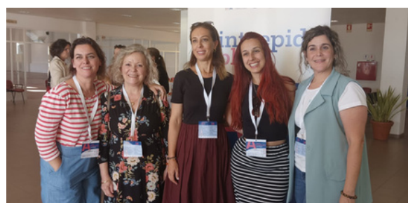
O INTREPIDA foi destacado pelas agências de notícias EFE e LUSA na série "Histórias Ibéricas" e foi vencedor do concurso POCTEP Cooperation Day '22

Com um forte impacto social, focou-se nos setores tradicionais da região transfronteiriça com potencial de exportação, apoiando 114 empresas.