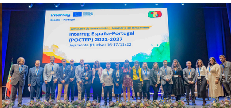
As entidades beneficiárias consideraram que as medidas de informação, comunicação e visibilidade implementadas pelo Programa tiveram um impacto significativo. FOTOS, da esquerda para a direita: seminário territorial em Sevilha, 2015, e seminário de lançamento do POCTEP 21-27 em Ayamonte, 2022.

Em relação às recomendações , houve duas que foram consideradas particularmente devido à sua alta viabilidade, prioridade e impacto esperado: a melhoria das funcionalidades e interface da aplicação Coopera 2020 (carregamento de dados, visualização e/ou downloads, etc.) e a simplificação administrativa na apresentação de candidaturas.