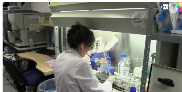
O IDIAL_NET foi um projeto destacado na série de reportagens das agências de notícias EFE e LUSA, intitulada "Histórias Ibéricas".

Com a participação de mais de 19 investigadores a tempo inteiro e o desenvolvimento de um software de análise automática de amostras, foram lançadas as bases para um programa interterritorial mais eficiente de deteção e acompanhamento desta doença.