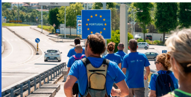
Os projetos POCTEP conseguiram mobilizar um grande número de agentes no território.