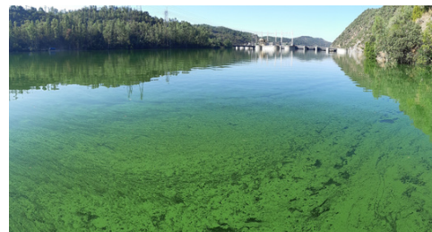
O ALBUFEIRA ajudou a sensibilizar sobre a importância das massas de água transfronteiriças.

O projeto também melhorou as metodologias de gestão dos rios partilhados e, através de atividades de divulgação, ajudou a aumentar a consciência sobre a importância da água como recurso comum a proteger.