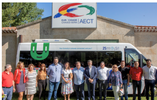
O transporte transfronteiriço Chaves-Verín: iniciativa pioneira de grande visibilidade

Este eixo conta com uma única PI e um total de 43 projetos financiados; o montante certificado foi de 34,8 M€, o que equivale a 7,8% do total certificado pelo Programa.