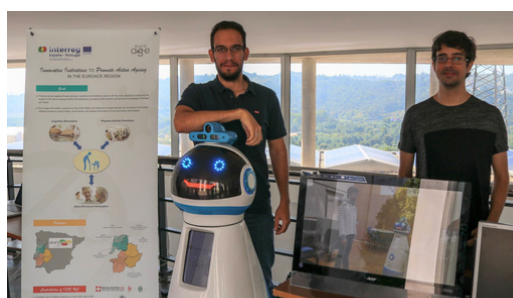
EUROAGE: estimulação física e cognitiva através de videojogos, robôs e domótica.

O projeto EUROAGE realizou ações para promover a autonomia física, cognitiva e socioemocional de pessoas dependentes, utilizando dispositivos de baixo custo. Entre os seus resultados, destaca-se o desenvolvimento de aplicações para a literacia em saúde da comunidade assistencial, ferramentas para estimulação física e cognitiva através de videojogos e a criação de demonstradores tecnológicos de robótica e domótica.