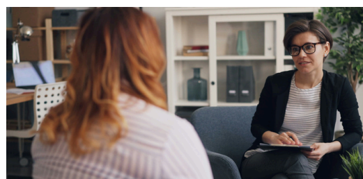
Apoio a vítimas de violência e promoção da conciliação familiar, entre os objetivos

No setor da melhoria da capacidade institucional, importa destacar o projeto EUROACE_VIOGEN , cujo objetivo era melhorar a atenção e proteção das mulheres vítimas de violência de género através da colaboração entre instituições de ambos os lados da fronteira, identificando interesses e problemas comuns, definindo soluções e reforçando os profissionais e agentes que trabalham na prevenção.